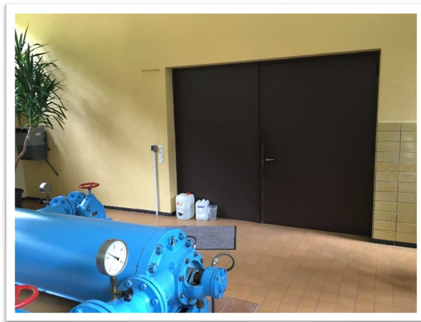
Bild 3: Ansicht auf die doppelflügelige Zugangstür im Erdgeschoss