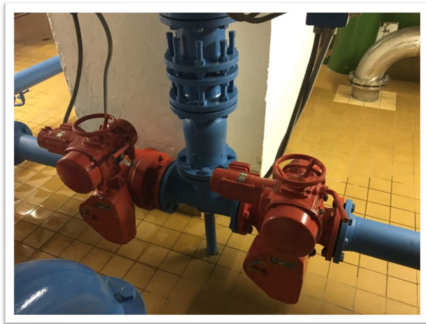
Bild 7: Detailansicht der bestehenden Kugelhähne mit Elektroantrieb im Rohrkeller